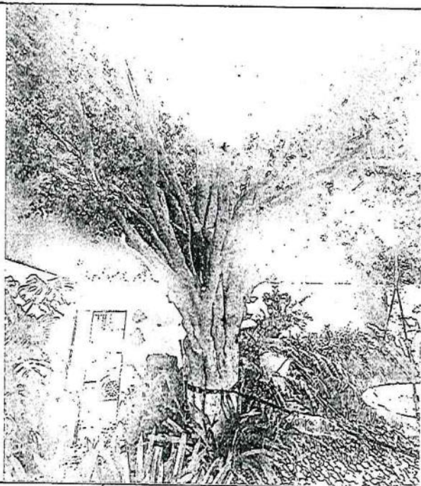
Arbol 1 Ficus ( Ficus benjamina )

DIRECCIÓN GENERAL DE MEDIO AMBIENTE, DESARROLLO SUSTENTABLE Y FOMENTO ECONÓMICO DIRECCIÓN DE ORDENAMIENTO ECOLÓGICO Y EDUCACIÓN AMBIENTAL SUBDIRECCIÓN DE ORDENAMIENTO ECOLÓGICO