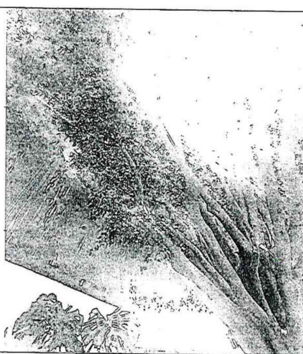
Arbol 1 Ficus ( Ficus benjamina )