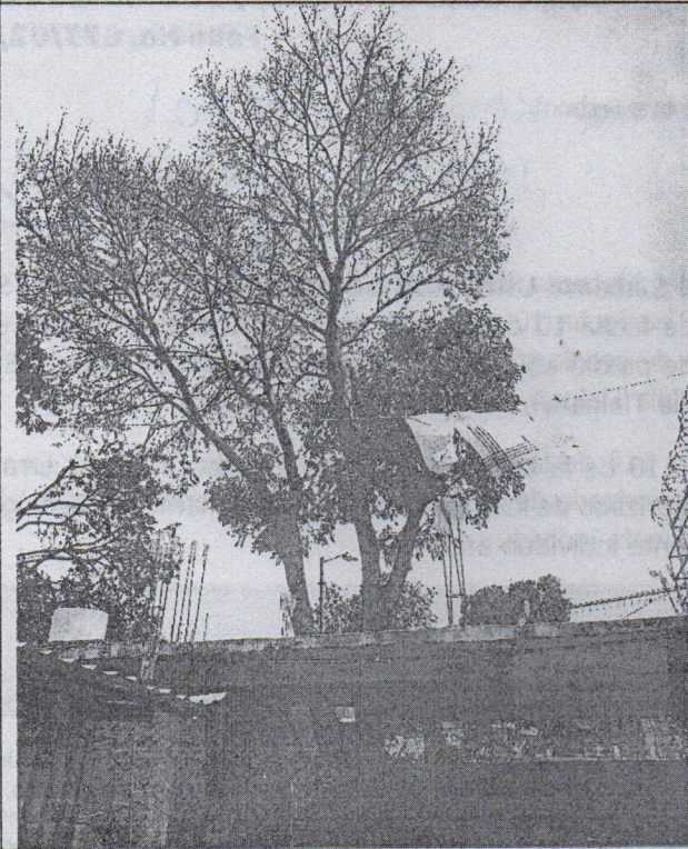
Árbol 1 Fresno ( Fraxinus sp. )