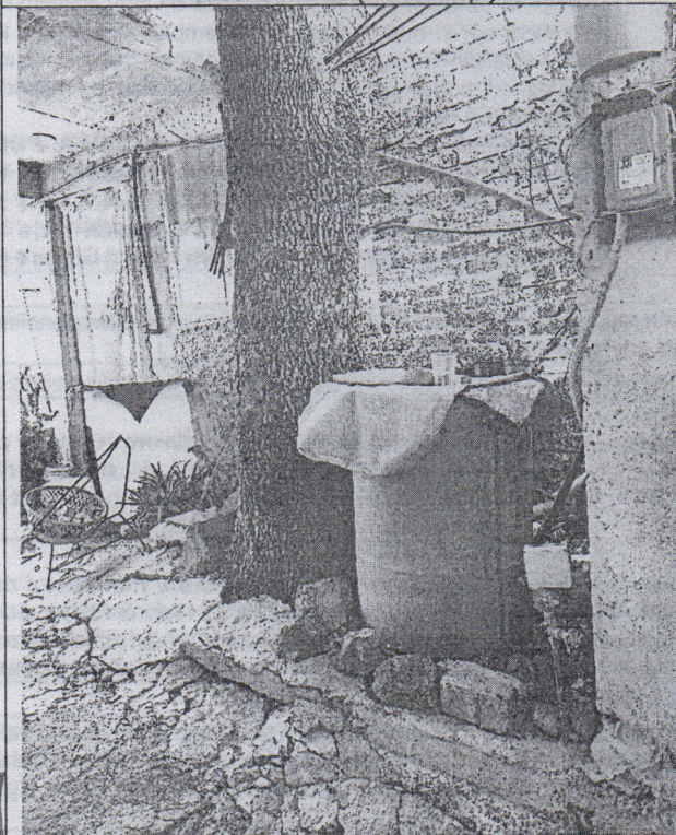
Árbol 1 Fresno ( Fraxinus sp. )