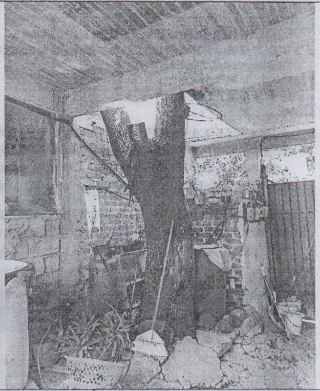
Árbol 1 Fresno ( Fraxinus sp. )