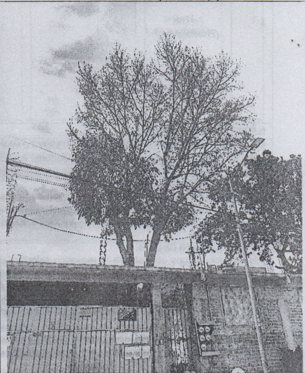
Árbol 1 Fresno ( Fraxinus sp. )