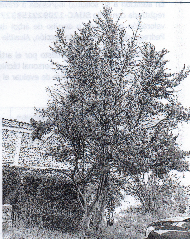
Árbol 1 Cedro limón ( Cupressus macrocarpa )

Lo anterior, con fundamento en lo dispuesto por los Artículos 4 Párrafo Quinto de la Constitución Política de los Estados Unidos Mexicanos; 13 Fracción A y Trigésimo Cuarto Transitorio de la Constitución de la Ciudad de México; 6 Fracción IV, 118, 119, 120 y 120 bis de la Ley Ambiental y de Protección a la Tierra en el Distrito Federal; 35 y 38 del Reglamento de la Ley Ambiental del Distrito Federal; 14 Fracción I, 29 Fracción X, 42 Fracción II, y 47 de la Ley Orgánica de las Alcaldías de la Ciudad de México; la Norma Ambiental para el Distrito Federal NADF-001-RNAT-2015; el Dictamen de Estructura Organizacional de la Alcaldía en Tlalpan de la Ciudad de México; el Manual Administrativo MA-02/260122-OPA-TLP-11/010819 de la Alcaldía Tlalpan, en el cual se establecen las facultades conferidas a la Subdirección de Ordenamiento Ecológico, respecto del procedimiento administrativo de emisión de dictamen de Poda, Derribo y Trasplante de árboles.