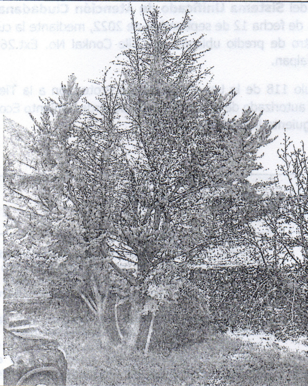
Árbol 1 Cedro limón ( Cupressus macrocarpa )

FRACCIÓN IV. Cuando deban ejecutarse para evitar afectaciones significativas en la infraestructura del lugar donde se encuentren.