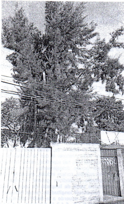
Casuarina ( Casuarina equisetifolia )