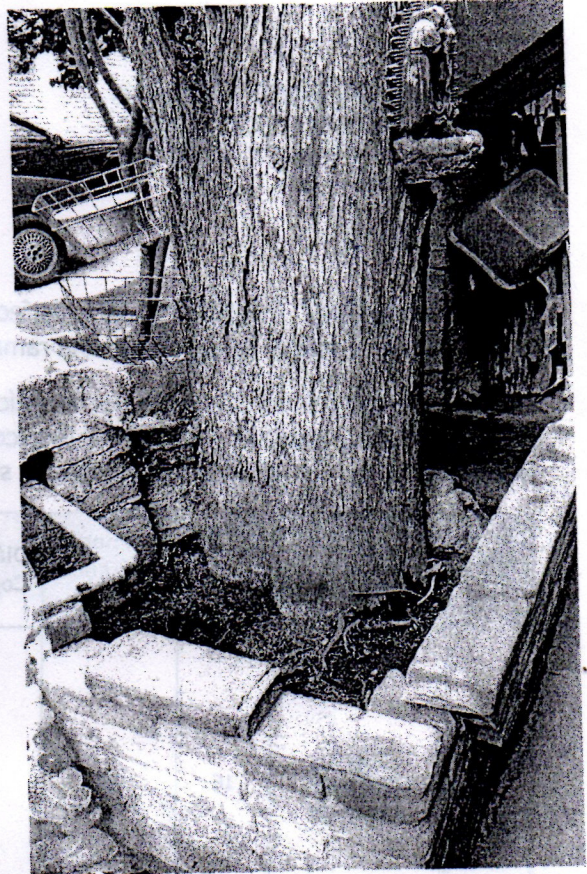
Cedro ( Callitropsis lusitanica )

Lo anterior, con fundamento en lo dispuesto por los Artículos 4 Párrafo Quinto de la Constitución Política de los Estados Unidos Mexicanos; 13 Fracción A y Trigésimo Cuarto Transitorio de la Constitución de la Ciudad de México; 6 Fracción IV, 118, 119, 120 y 120 bis de la Ley Ambiental y de Protección a la Tierra en el Distrito Federal; 35 y 38 del Reglamento de la Ley Ambiental del Distrito Federal; 14 Fracción I, 29 Fracción X, 42 Fracción II, y 47 de la Ley Orgánica de las Alcaldías de la Ciudad de México; la Norma Ambiental para el Distrito Federal NADF-001-RNAT-2015; el Dictamen de Estructura Organizacional de la Alcaldía en Tlalpan de la Ciudad de México; el Manual Administrativo MA-54/231219-OPA-TLP-11/010819 de la Alcaldía Tlalpan, en el cual se establecen las facultades conferidas a la Subdirección de Ordenamiento Ecológico, respecto del procedimiento administrativo de emisión de dictamen de Poda, Derribo y Trasplante de árboles.