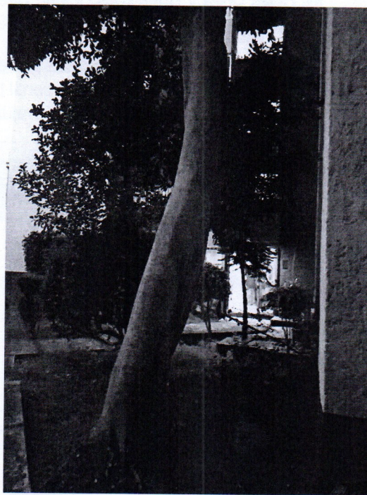
Árbol. Ficus retusa, Ficus microcarpa (Laurel de la India) Edificios D-2 y D-3