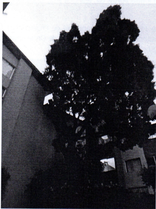
Árbol. Ficus retusa, Ficus microcarpa (Laurel de la India) Edificios D-2 y D-3

FRACCIÓN IV. Cuando deban ejecutarse para evitar afectaciones significativas en la infraestructura del lugar donde se encuentren.