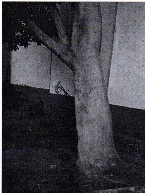
Árbol. Ficus retusa, Ficus microcarpa (Laurel de la India) Edificios D-2 y D-3