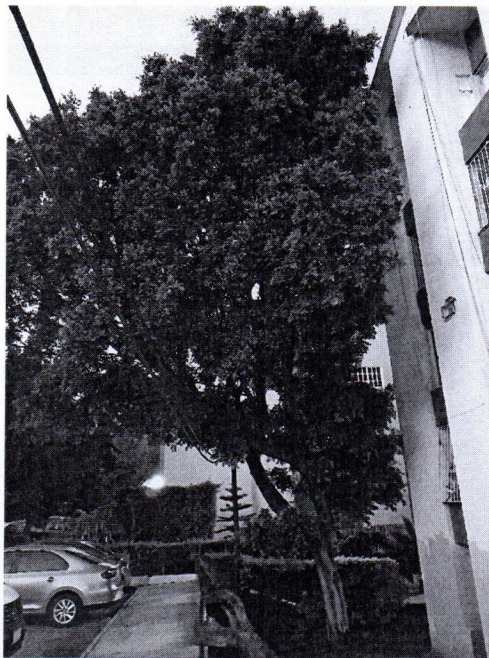
Árbol. Ficus retusa, Ficus microcarpa (Laurel de la India) Edificios D-3 y D-4