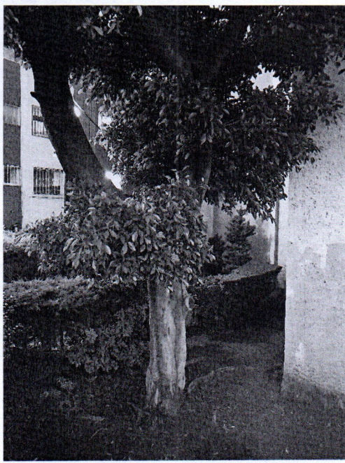
Árbol. Ficus retusa, Ficus microcarpa (Laurel de la India) Edificios D-3 y D-4