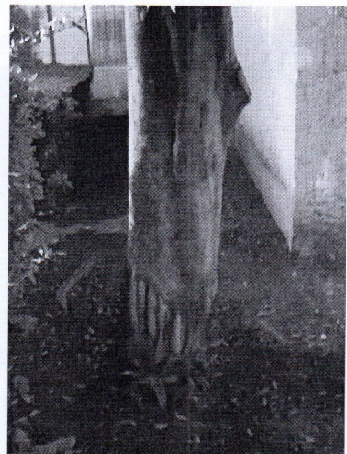
Árbol. Ficus retusa, Ficus microcarpa (Laurel de la India) Edificios D-3 y D-4

Lo anterior, con fundamento en lo dispuesto por los Artículos 4 Párrafo Quinto de la Constitución Política de los Estados Unidos Mexicanos; 13 Fracción A y Trigésimo Cuarto Transitorio de la Constitución de la Ciudad de México; 6 Fracción IV, 118, 119, 120 y 120 bis de la Ley Ambiental y de Protección a la Tierra en el Distrito Federal; 35 y 38 del Reglamento de la Ley Ambiental del Distrito Federal; 14 Fracción I, 29 Fracción X, 42 Fracción II, y 47 de la Ley Orgánica de las Alcaldías de la Ciudad de México; la Norma Ambiental para el Distrito Federal NADF-001-RNAT-2015; el Dictamen de Estructura Organizacional de la Alcaldía en Tlalpan de la Ciudad de México; el Manual Administrativo MA-54/231219-OPA-TLP-11/010819 de la Alcaldía Tlalpan, en el cual se establecen las facultades conferidas a la Subdirección de Ordenamiento Ecológico, respecto del procedimiento administrativo de emisión de dictamen de Poda, Derribo y Trasplante de árboles.