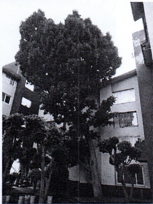
Árbol. Ficus retusa, Ficus microcarpa (Laurel de la India) Edificios D-2 y D-3