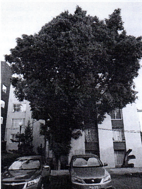
Árbol. Ficus retusa, Ficus microcarpa (Laurel de la India) Edificios D-3 y D-4