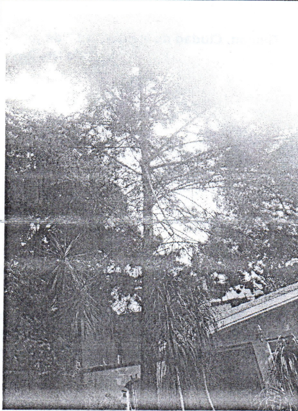
Cedro ( Callitropsis lusitanica )